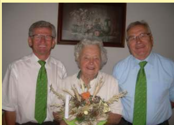
85. Geburtstag: Puntigam Leopoldine