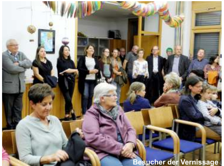
Besucher der Vernissage