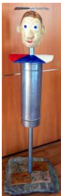
Skulptur von Hermenegild Stadlmann